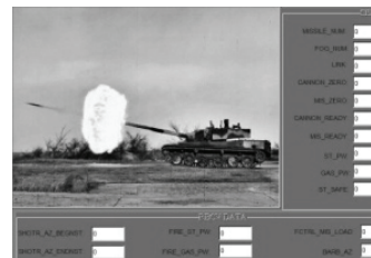
图 3 控件刷新后效果