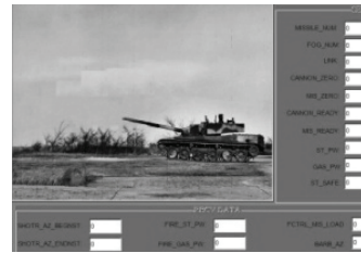
图 2 控件刷新前效果

以 Multi State Object 为例，当界面收到用户 TRT_ChTrigger 消息时，对 Multi-State Object 的状态进行刷新，效果如图 2 和图 3 所示。