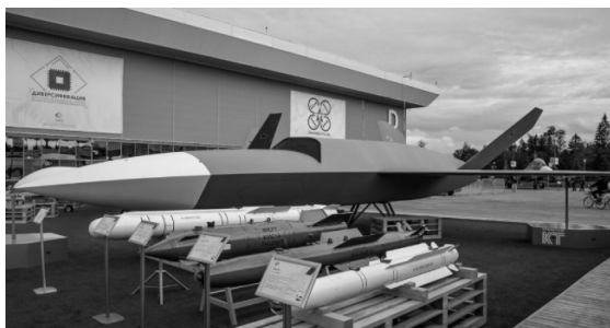
图 6 雷霆无人机

苏-70 猎人无人机项目的研制最早可以追溯到 2011 年,但直至 2019 年俄罗斯才以视频展示的方式揭开了苏-70 的面纱,同时也指明了苏-70 设计的初衷就是与苏-57 协同作战。苏-70 属于重型飞机,相比于同期的其他无人机(美国的 X-47B、英国的“雷神”等),其翼展约为 20 m,重量大于 20 t,时速可达 1 000 km/h 以上,作战半径约为 6 000 km,内置 2 个武器弹药库(可装载约 3 t 的武器弹药),具备相当强的隐身功能。2020 年与苏-57 进行了编队飞行试验,2021 年更是实现了一架苏-57 与四架苏-70 协同作战的飞行试验。在苏-70 猎人重型无人机研发的同时,俄罗斯的 Kronshtadt 集团也研发了另外一款轻型隐身无人作战飞机—雷霆无人机(图 6)用于与米格-29、米格-35 组成有人/无人机协同作战编队 [22-23] 。