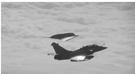
图 8 阵风战斗机与神经元无人机混合编队

进入新世纪后,除美国、俄罗斯、澳大利亚外,英国、法国、德国也在加紧研发本国的有人/无人机协同作战项目。如英国在 2007、2012 年就进行了狂风战斗机与 4 架 BAC 无人机混合编队协同作战相关的试验验证;法国在 2014 年也进行了阵风战斗机与神经元无人机混合编队(图 8)协同作战相关试验验证;德国在 2012 年则进行了有人直升机与无人机混合编队协作作战相关试验验证。