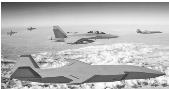
图 3 美国空军“忠诚僚机”

2015 年美国空军研究实验室携手洛克希德·马丁公司正式启动“忠诚僚机”项目,并于 2015 年与 2017 年先后选用 F-16 四代战斗机(有人机)与 QF-16 无人机(F-16 改装无人机)开展了 2 个阶段(“海弗—空袭者 1”与“海弗—空袭者 2”)的试验验证,这两阶段的试验主要进行了飞控技术、数据链通信技术等技术验证。经过层层选拔,美国空军最终选择了波音公司、通用原子公司以及克瑞托斯防务公司 3 家公司开展合作(“忠诚僚机”项目制造僚机)。这 3 家公司也在 2020 年 12 月获得了美国空军的合同,但是在 2021 年 8 月美国空军公布的“忠诚僚机”项目第 2 阶段研发工作时只剩下了通用原子公司与克瑞托斯防务公司。克瑞托斯防务公司研发的 XQ-58A 女武神(图 4)与 UTAP-22 “灰鳍鲨”先后于 2019 年 3 月与 2021 年 4 月完成首飞,截至目前 XQ-58A 已经进行了 6 次试验;而通用原子的 MQ-20 “复仇者”式匿踪无人机也于 2021 年 6 月完成了首飞 [19] 。