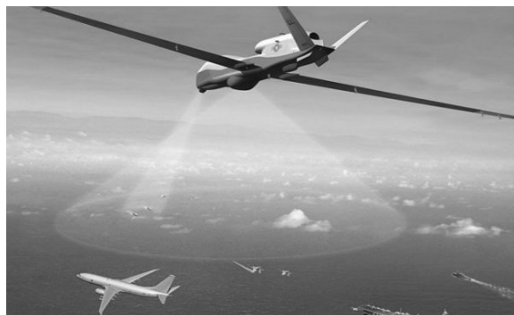
图 2 美国海军 P-8A 与 MQ-4C 协同作战

美国陆、海、空三军启动了一系列有关有人/无人机协同作战的项目,例如美国陆军的 AMUST 项目、美国海军的 TCS 项目,美国空军的 SEC 项目,但是其中最典型的当属美国空军的“忠诚僚机”项目。“忠诚僚机”这一概念其实早在 20 世纪初就由美国一些专家学者提出来了,但当时的科学技术发展水平并不足以支撑该项目的启动研发,所以该计划搁浅。直至 2015 年,美国空军研究实验室觉得技术等条件成熟后,就顺势提出了该项目计划,并先后与洛克希德·马丁公司、波音公司、通用原子公司以及克瑞托斯防务公司等公司开展了相关项目研究 [18] 。