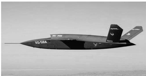
图 4 XQ-58A 女武神

2015 年美国空军研究实验室携手洛克希德·马丁公司正式启动“忠诚僚机”项目,并于 2015 年与 2017 年先后选用 F-16 四代战斗机(有人机)与 QF-16 无人机(F-16 改装无人机)开展了 2 个阶段(“海弗—空袭者 1”与“海弗—空袭者 2”)的试验验证,这两阶段的试验主要进行了飞控技术、数据链通信技术等技术验证。经过层层选拔,美国空军最终选择了波音公司、通用原子公司以及克瑞托斯防务公司 3 家公司开展合作(“忠诚僚机”项目制造僚机)。这 3 家公司也在 2020 年 12 月获得了美国空军的合同,但是在 2021 年 8 月美国空军公布的“忠诚僚机”项目第 2 阶段研发工作时只剩下了通用原子公司与克瑞托斯防务公司。克瑞托斯防务公司研发的 XQ-58A 女武神(图 4)与 UTAP-22 “灰鳍鲨”先后于 2019 年 3 月与 2021 年 4 月完成首飞,截至目前 XQ-58A 已经进行了 6 次试验;而通用原子的 MQ-20 “复仇者”式匿踪无人机也于 2021 年 6 月完成了首飞 [19] 。