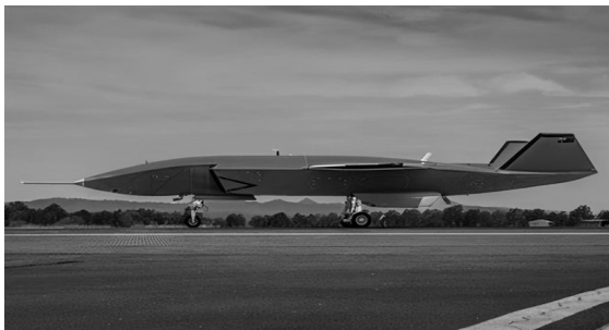
图 7 ATS 无人机

ATS 无人机(图 7)机身长约 11.5 m,翼展可达 7 m,作战半径可达 3 200 km,隐身性能优异,机头约 2.6 m,易拆卸,可用于装载各种传感器或有效载荷,即能够根据任务需求的不同而装载不同的传感器。自主性、智能化程度高,几乎无需接受地面远程指控,具备一定的自主作战能力。ATS 无人机于 2020 年 5 月完成了首机的组装,10 月进行了地面低速滑行试验,2021 年 3 月实现了首飞测试。