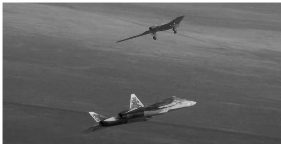
图 5 苏-57 与苏-70“猎人”无人机协同作战

自己的一款无人机——苏-70 猎人无人机(图 5),打算扭转其在无人机领域的严重劣势 [20-21] 。而受美国的有人/无人机协同作战项目影响,所以苏-70 在开发伊始也兼具了僚机的用途。