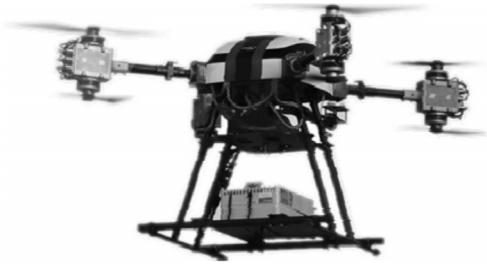
图 2 4 轴 8 旋翼共轴系留无人机

如图 2 所示,系留无人机一般采用多旋翼方式,包括 4 旋翼、6 旋翼、4 轴 8 旋翼、6 轴 12 旋翼等不同结构。共轴多旋翼无人机的动力系统采用冗余设计,在单桨故障情况下,无人机仍然能够悬停工作,提高无人机可靠性,一般多用于军用领域;4 旋翼或 6 旋翼成本低、重量轻,主要用于民用领域 [5-7] 。