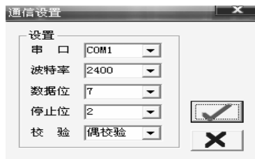
图 3 DNC 通信设置

果可为叶片包容性设计提供参考。但由于在进行的叶片包容性瞬态响应数值仿真时, 未考虑撞击过程中相邻未断叶片的影响以及摩擦和阻尼的影响, 下一步, 将在考虑摩擦和阻尼条件下, 对叶片包容性瞬态影响进行研究。