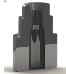
图 2 枪弹合膛规三维实体

2) 选择主功能表【Solids】实体功能，选择【Extrude】挤出，在选择图素菜单中点击【chain】串联，串联图素后，点击【Done】执行，确定拉伸方向后，点击【Done】执行，在弹出的参数设置框内设置拉伸参数，实体挤出，如图 2。